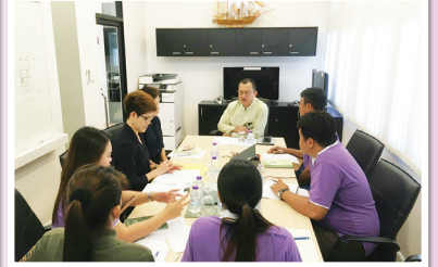
“ประมวลภาพการประชุมกิจกรรมงานเปิด - ปิดการตรวจสอบกับหน่วยรับตรวจ”